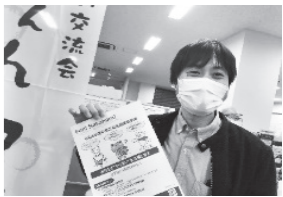
中原区企画課からも充実の団体支援メニュー紹介