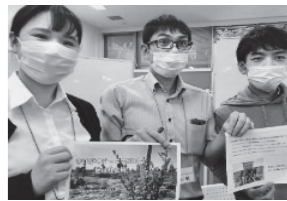
「まいばすけっと労働組合地域社会局」のみなさん