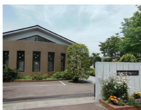
虹ヶ丘こども文化センター(麻生区)