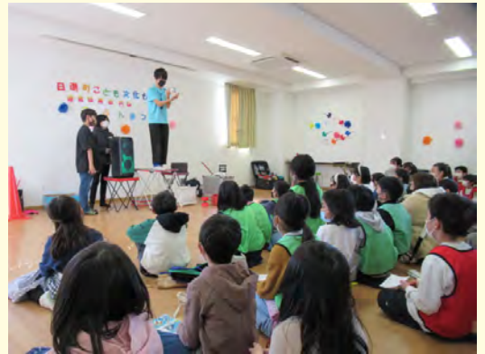
中学生によるオープニングのマジックショー

「withコロナ」の新しい形のまつりがこども文化センターにも戻り、今回楽しい交流を体験した子どもたちと、いつも温かい目で見守って下さる運営協議会の方々が今後も大きな支えとなっていくと感じました。