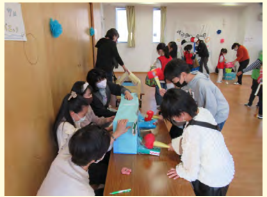
ゲームコーナー ワニさめパニックの様子

※こぶんたは、当財団が管理運営するこども文化センター53施設のキャラクターです。※わくりんは、当財団が管理運営するわくわくプラザ102施設のキャラクターです。