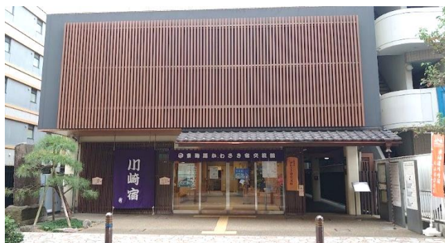
東海道かわさき宿交流館外観

内容 「かわさき歴史ガイド協会」は、川崎に残る数多くの史跡や産業文化遺産を多くの方たちに知ってもらい、後世に伝え残そうと活動しています。活動内容や、発足からの活動の変遷、ニーズの変化などのお話を伺います。参加者同士の交流タイムもあります。